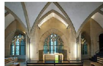
Kapelle im Stift Urach